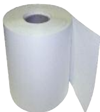
BANDA NT 30