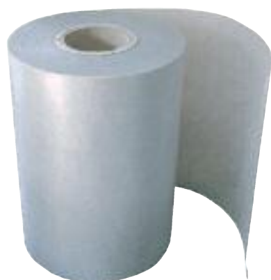
BANDA GT 30